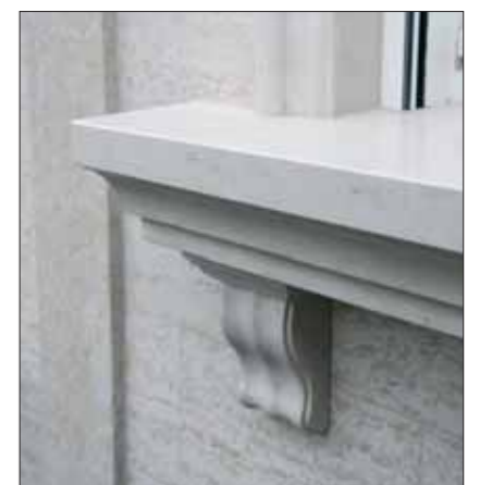
Lebendig und elegant